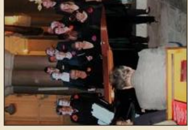
■ Le chœur Symphonique fait passer au public u